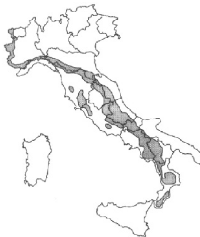
Fig. 2 - Areale di distribuzione attuale (Spagnesi e De Marinis, 2002)

Oggi si stima la presenza di 500-600 lupi, che risultano presenti sull'intera catena appenninica, dall'Appennino ligure all'Aspromonte. Importanti ramificazioni si hanno inoltre nel Lazio settentrionale e nella Toscana centro-meridionale. Il lupo è presente stabilmente anche sulle Alpi occidentali (sia sul versante italiano che su quello francese). Attualmente non vi sono invece segnalazioni della presenza di lupi sulle Alpi orientali ma, vista la prossimità della piccola popolazione di lupi slovena, non è da escludere che in un prossimo futuro si abbiano segnalazioni anche da quel versante.